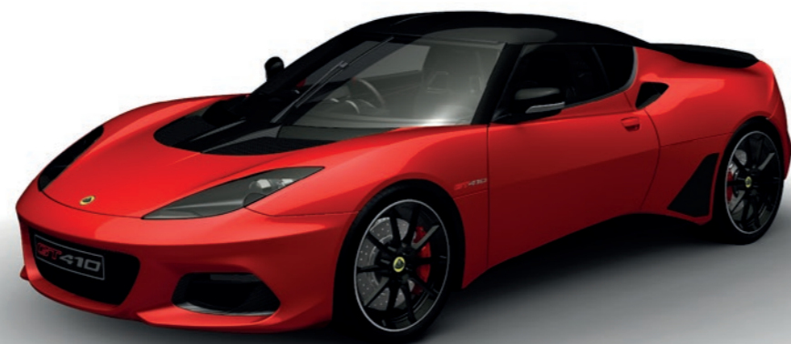
ROUGE SOLIDE C183