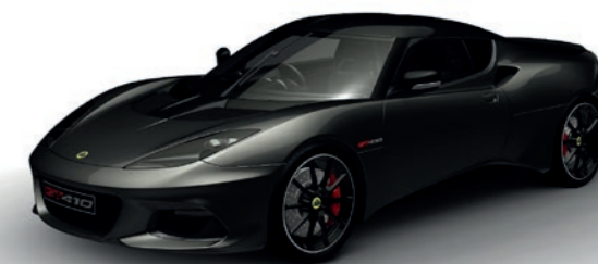
GRIS FONCÉ MÉTALLISÉE C213