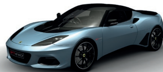
BLEU CLAIR MÉTALLISÉE C208