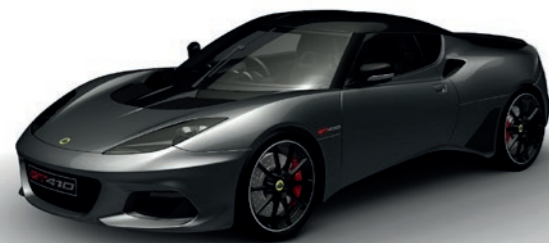
GRIS MÉTALLISÉE C185